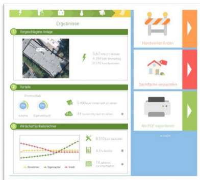
Abb. 1: Ergebnisseite im Solarpotenzialkataster der Städtereion Aachen

Die Solardachbörse können Sie z.B. im Solarpotenzialkataster der Stadt Wuppertal sehen: http://www.solare-stadt.de/wuppertal/Solardachboerse Ein weiteres Beispiel ist die Solardachbörse der Städtereion Aachen: http://www.solare-stadt.de/staedtereion-aachen/Solardachboerse .